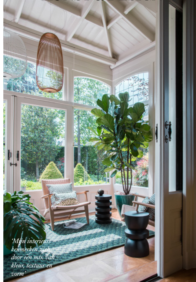
'Mijn interieurs kenmerken zich door een mix van kleur, textuur en vorm'