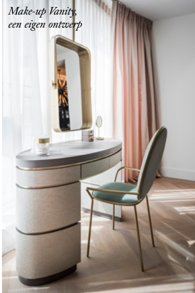
Make-up Vanity, een eigen ontwerp